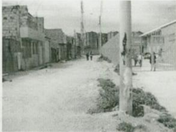
Vías de acceso.

La plataforma logística Los Luceros, se encuentra ubicada en la carrera 17 F número 69ª-20 sur barrio Alameda Localidad 19, ciudad Bolívar, en un lote de 3.736,07 mts cuadrados. El propósito de dicha construcción de uso dotacional es el de satisfacer las necesidades de alimentos de los ciudadanos del sector , y consta de una edificación de tres pisos de altura y un sótano con 41 parqueaderos: dos para minusválidos, siete para muelles de carga y descarga y los restantes para la labor propia.