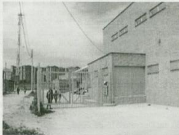
Panorámica Plataforma.

Conforme a lo dispuesto en el capítulo 5º., del Acuerdo 257 Ídem, el Sector Desarrollo Económico, Industria y Turismo, tiene la misión de “crear y promover condiciones que conduzcan a incrementar la capacidad de producción de bienes y servicios en Bogotá, de modo que se garantice soporte material de las actividades económicas y laborales que permitan procesos productivos, de desarrollo de la iniciativa y de inclusión económica que hagan efectivos los derechos de las personas y viables el avance social y material del Distrito Capital y sus poblaciones, en el marco de la dinámica ciudad región” .